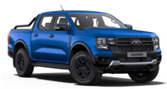
Blue Lighting metalická