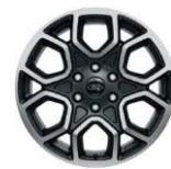
20" zliatinové disky voliteľne Wildtrak