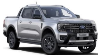
Iconic Silver metalická