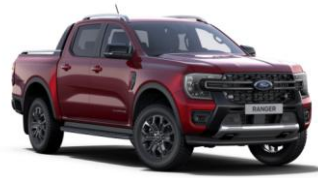
Lucid Red metalická