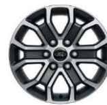
18" zliatinové disky voliteľne Limited