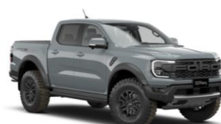
Command Grey FORD Performance