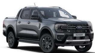
Carbonized Grey metalická