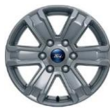
17" zliatinové disky voliteľne pre XLT