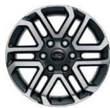
18" zliatinové disky séria Limited