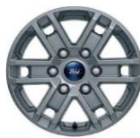
16" zliatinové disky séria XLT