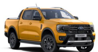
Cyber Orange metalická