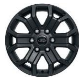
18" zliatinové disky séria Wildtrak