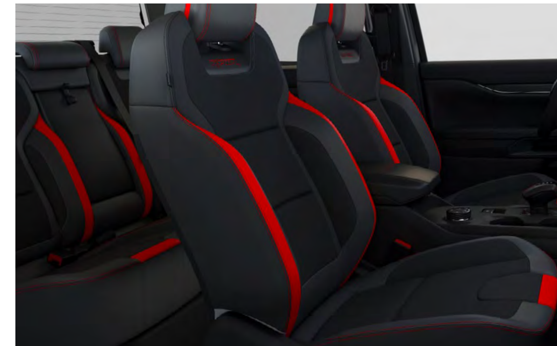
Super Matte-läder och Dinamica Auto Miko-mocka i Ebony (med Code Orange-detalj) Standard på Raptor

OBS! Sensico® är ett Ford EU-varumärke för syntetisk premiumklädsel utvecklad för bilinteriorer. Det är en vegansk klädsel som kombinerar en exklusiv mjuk känsla med hållbarhet och elegant utseende. Den är underhållsvänlig, lätt att rengöra och är fläck- och luktbeständig. Sensico® har inte bara ett lyxigt utseende, det är även fantastiskt skönt att sitta på under långa resor och ger dig också gott samvete eftersom den inte är animaliebaserad. Det är en design som ger sinnesfrid för moderna bilägare som söker det där lilla extra.