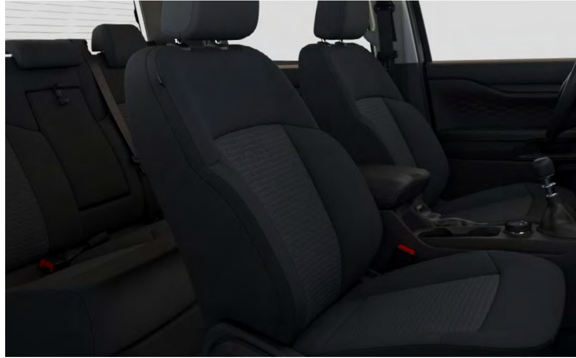
City-tyg (Elevate-präglat) i Ebony Standard på XLT