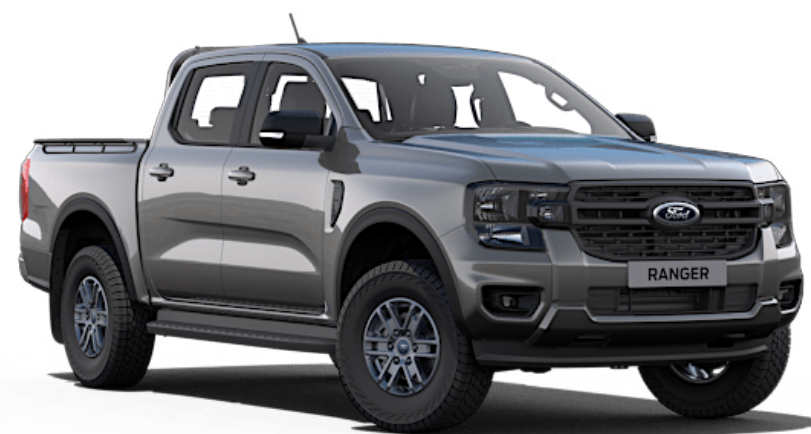
Carbonized Grey †† Metallic