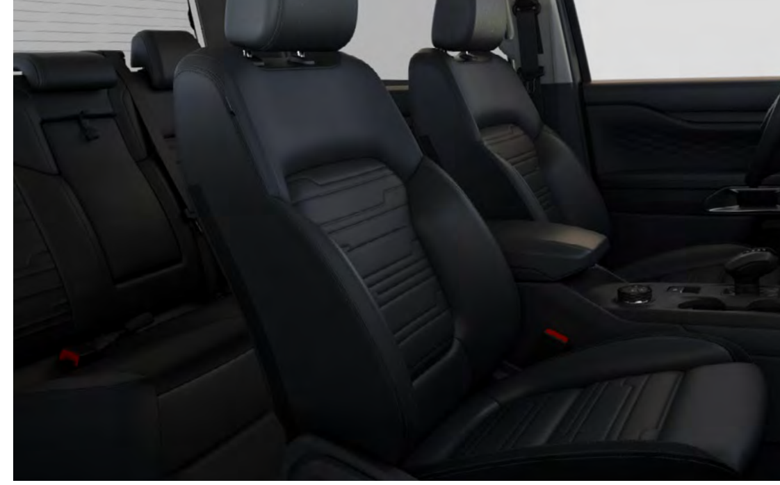
Soho-läder (Apex-präglat) i Ebony Standard på Limited