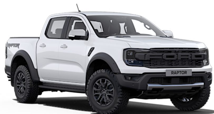
Arctic White † Solid