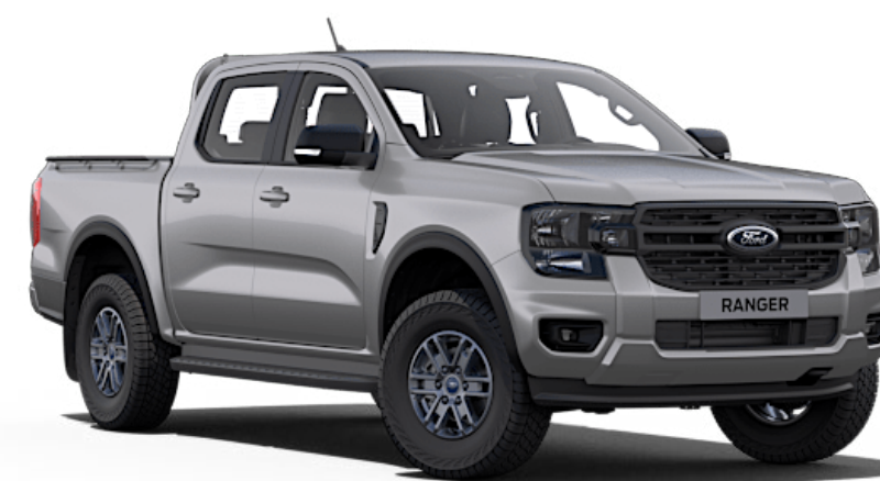
Iconic Silver †† Metallic