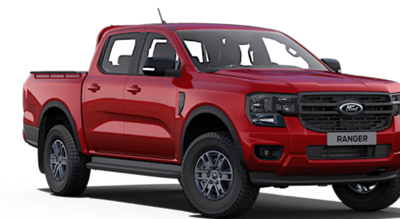
Lucid Red †† Metallic