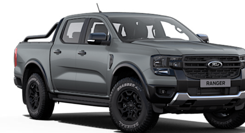
Command Grey ††† Metallic