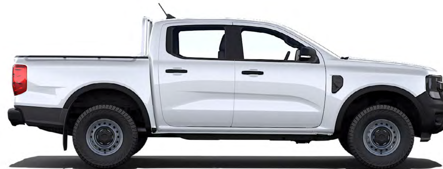
RANGER DOUBLE CAB

Nya Ford Ranger är mångsidig och är tillgänglig i ett stort antal karosstyper och serier. Med flera olika klädselalternativ och motorer och massor av funktioner och finesser hittar du lätt den Ranger som passar dig.