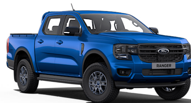
Blue Lightning † Metallic