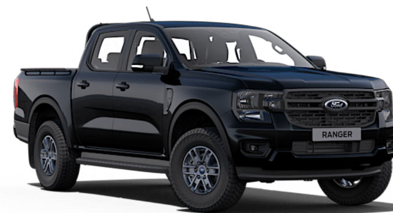
Agate Black ∅ Metallic