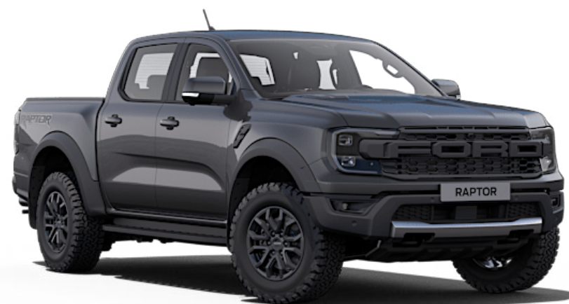
Meteor Grey † Metallic