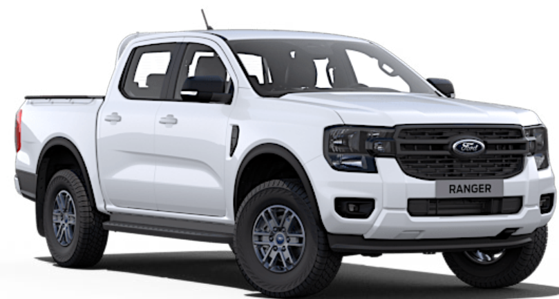
Frozen White †† Solid