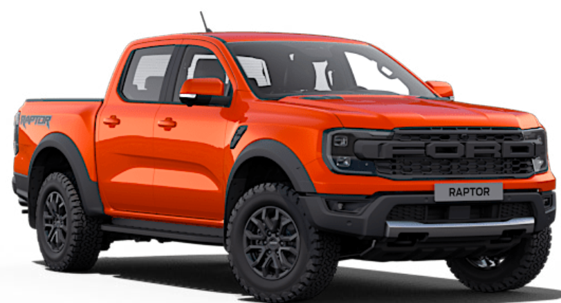
Code Orange † Solid