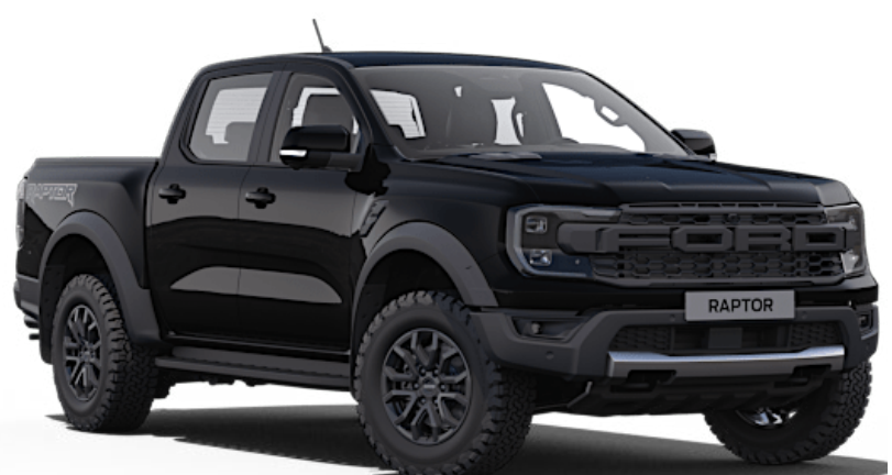
Absolute Black † Metallic