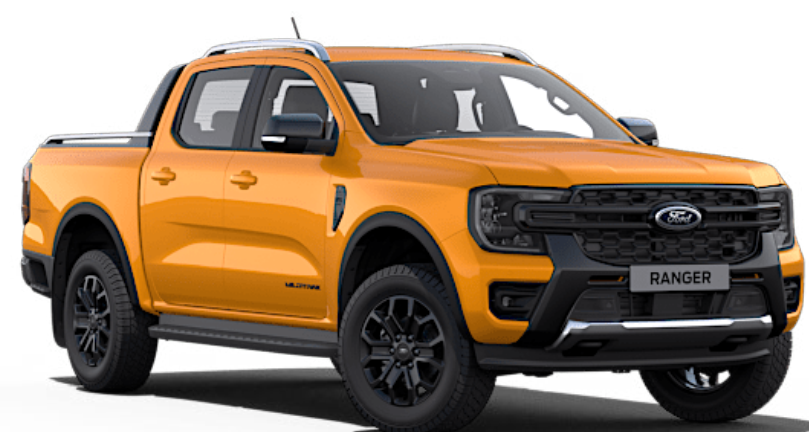
Ignite Orange †† Metallic