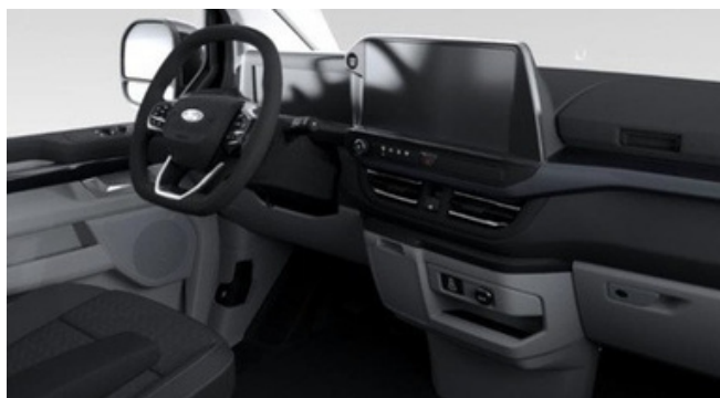
Ford Tourneo Custom Titanium versijas interjers