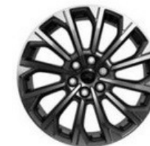
„Pearl Grey” krāsas daudzspieķu vieglmetāla diski