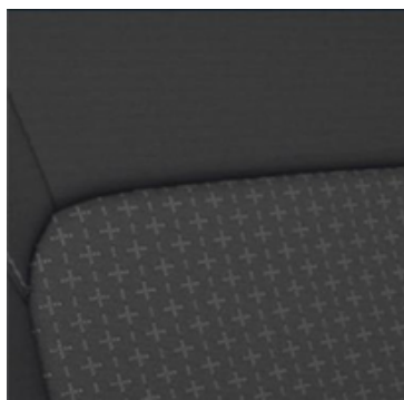
Tumšas krāsas tekstila sēdekļu apdare