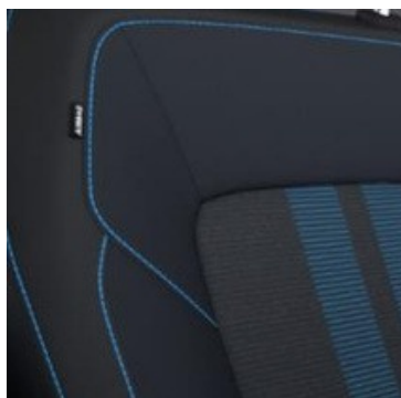
Zilas krāsas tekstila sēdekļu apdare