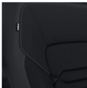
Melnas ādas sēdekļu apdare