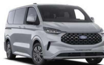
Krāsa: Grey Matter