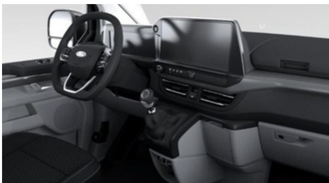
Ford Tourneo Custom Trend versijas interjers