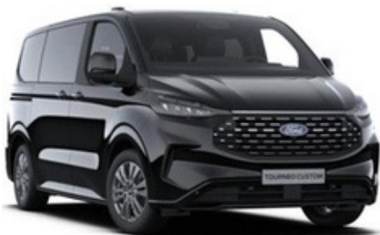
Krāsa: Agate Black