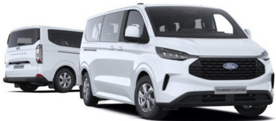
Ford Tourneo Custom Trend versija „Frozen White” krāsā (pēc izvēles)