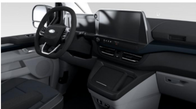
Ford Tourneo Custom Active versijas interjers