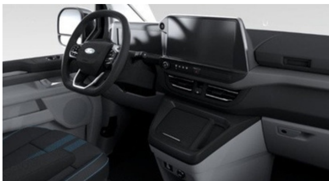
Ford Tourneo Custom Sport versijas interjers