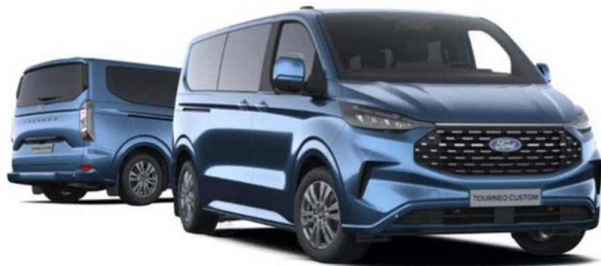
Ford Tourneo Custom Titanium versija „Blue Metallic“ krāsā (pēc izvēles)