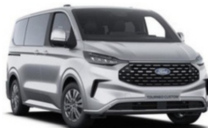
Krāsa: Moondust Silver