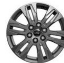
„Carbonised Grey” krāsas vieglmetāla diski