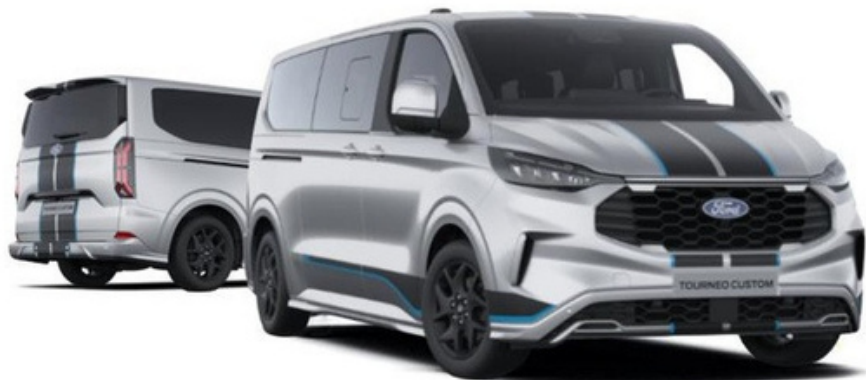
Ford TourneoCustom Sport versija „Moondust Silver” krāsā (pēc izvēles)