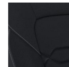
Melnas krāsas ādas sēdekļu apšuvums