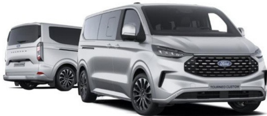
Ford Tourneo Custom Titanium X versija „Moondust Silver“ krāsā (pēc izvēles)