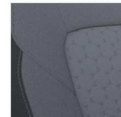
Pelēkas krāsas tekstīla sēdekļu apšuvums