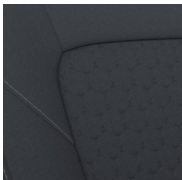
Tamsios spalvos tekstilīnīai sēdviņapmušalai