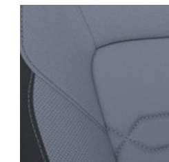
Pelēkas krāsas ādas sēdekļu apšuvums