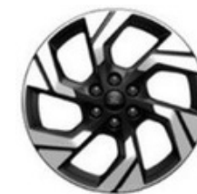
„Absolute Black” krāsas daudzvirzienu spieķu vieglmetāla diski