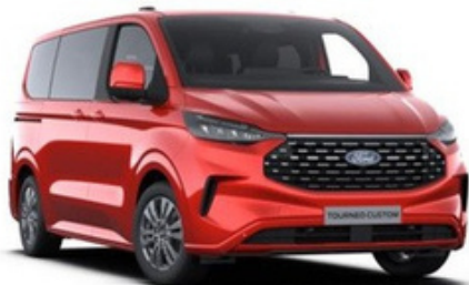
Krāsa: Artisan Red