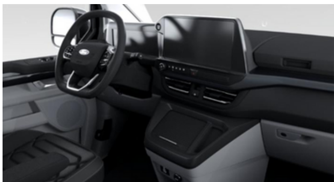
Ford Tourneo Custom Titanium X versijas interjers