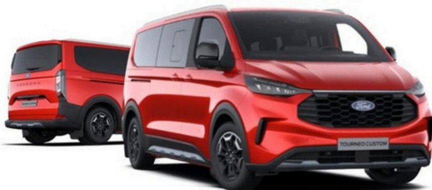
Ford Tourneo Custom Active versija „Artisan Red“ krāsā (pēc izvēles)