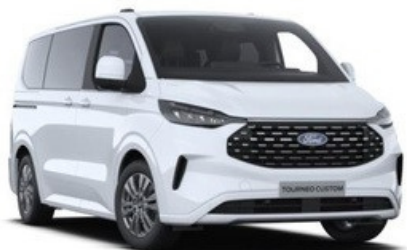
Krāsa: Frozen White