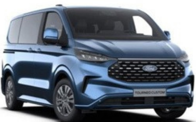
Krāsa: Blue Metallic