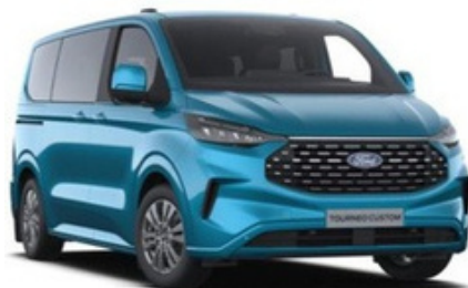
Krāsa: Digital Blue Aqua