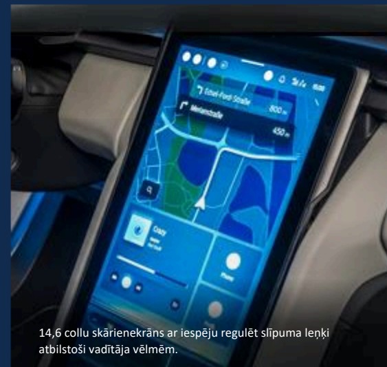
14,6 collu skārienekrāns ar iespēju regulēt slīpuma leņķi atbilstoši vadītāja vēlmēm.