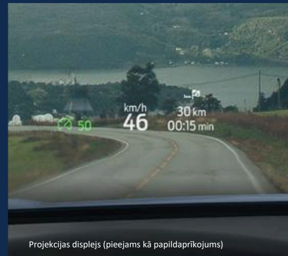
Projekcijas displejs (pieejams kā papildaprīkojums)