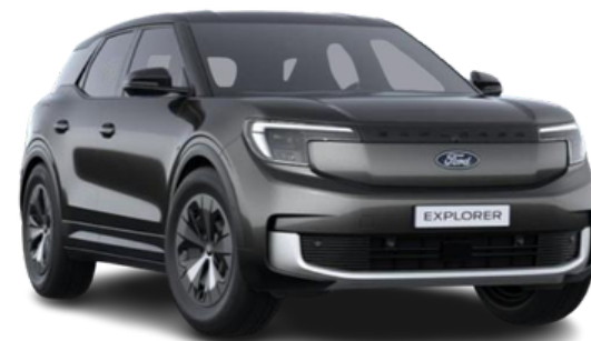
Krāsa: Magnetic grey