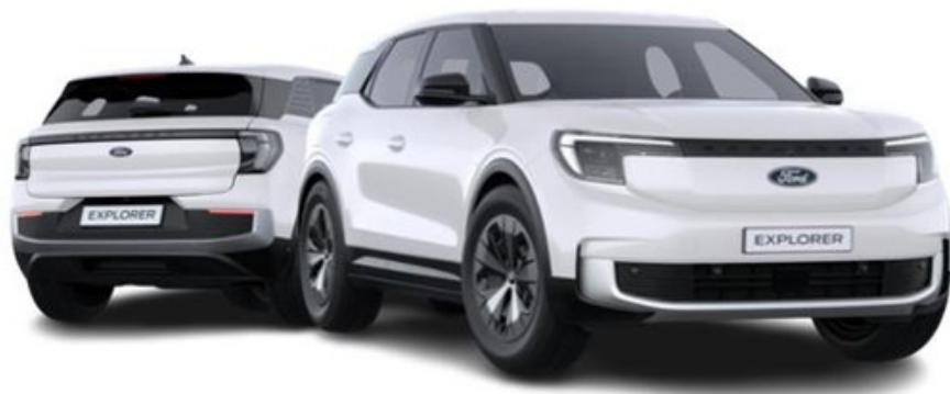
Ford Explorer Style versija „Frozen White” krāsā (pēc izvēles)