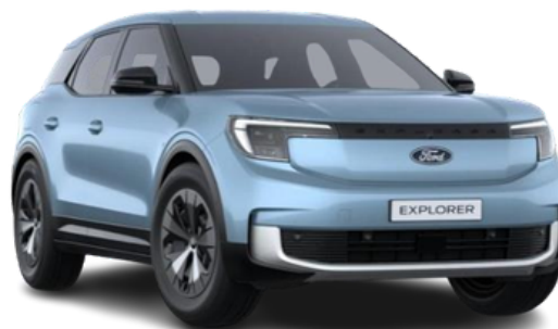
Krāsa: Arctic Blue