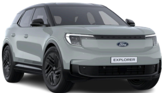
Krāsa: Cactus Gray