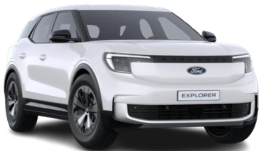
Krāsa: Frozen White