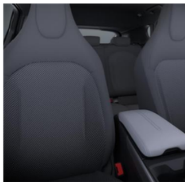
Tumšas krāsas tekstila sēdekļu apdare