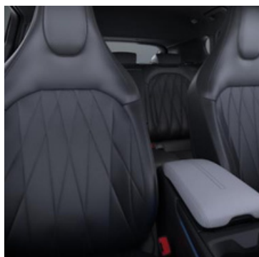
Tumšas krāsas sensico eco ādas sēdekļu apdare