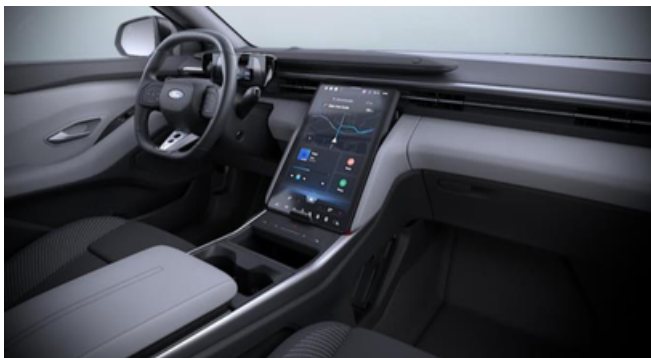
Ford Explorer Style versijas interjers