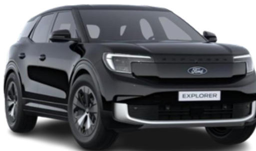
Krāsa: Agate Black