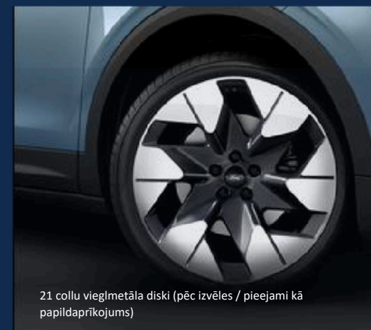
21 collu vieglmetāla diski (pēc izvēles / pieejami kā papildaprīkojums)