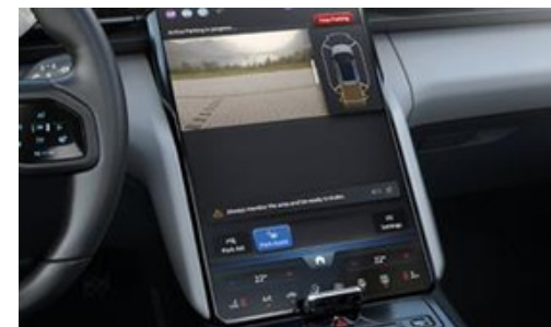
Stūrēšanas palīg sistēmu pakotne