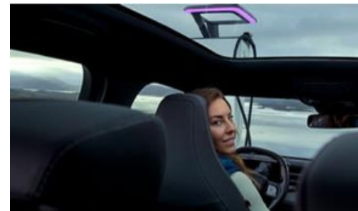
Panorāmas jumta lūka