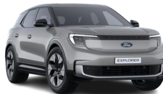
Krāsa: Solar Silver