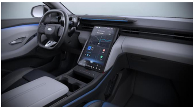
Ford Explorer Premium versijas interjers