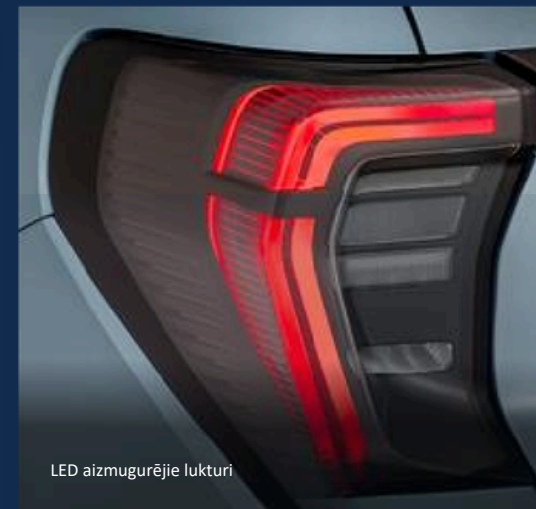
LED aizmugurējie lukturi

Pateicoties 77 kWh baterijai un līdz 602 km nobraukumam (WLTP), ar Explorer var aizmirst par biežu apstāšanos uzlādei. Tas ir kluss, jaudīgs un komfortabls SUV, kas simbolizē jaunās paaudzes ceļošanas brīvību.