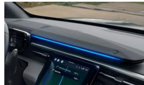
„B&O” audio sistēma